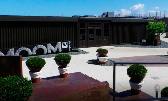
Sala Moom 57 Paseo Ronda, 57 A Coruña